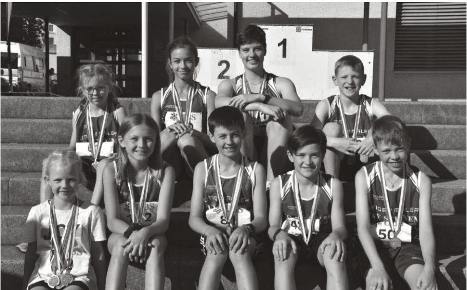
Die Schnellsten über 600 Meter