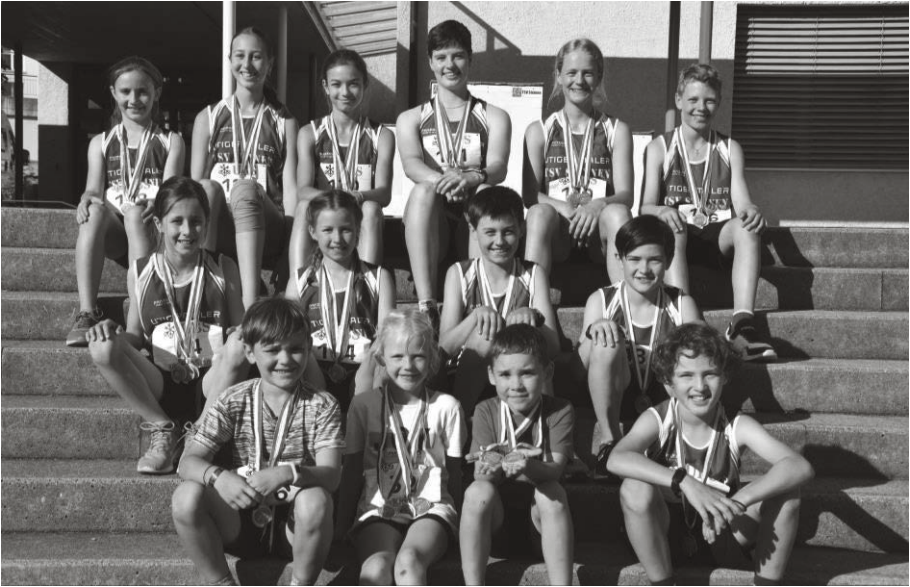
Die SiegerInnen im UBS Kids Cup (Dreikampf)